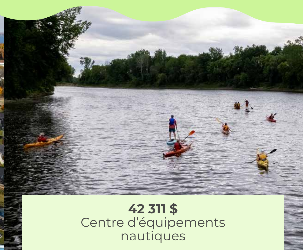
42 311 $ Centre d'équipements nautiques