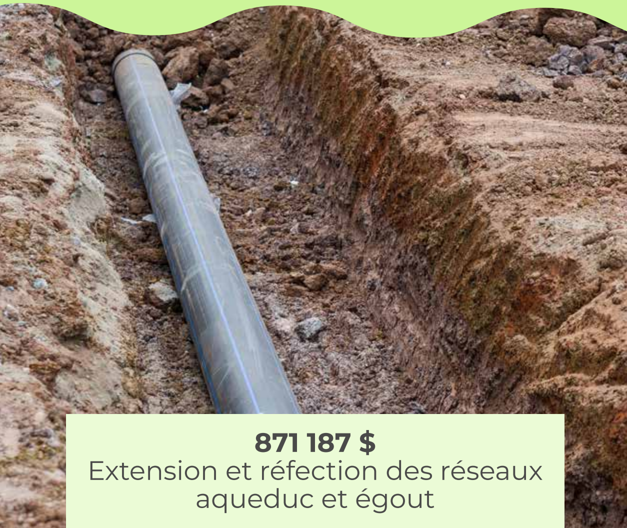
871 187 $ Extension et réfection des réseaux aqueduc et égout