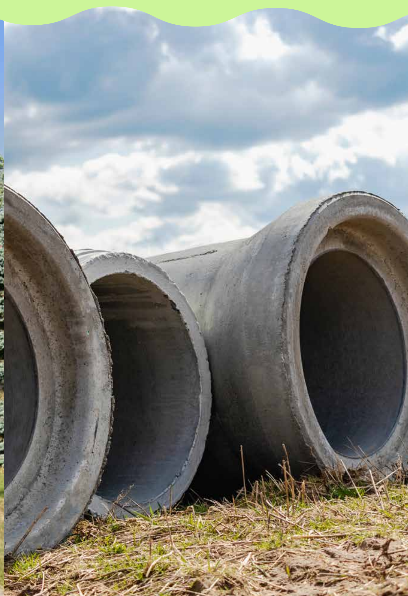
Infrastructures résilientes et croissance soutenue