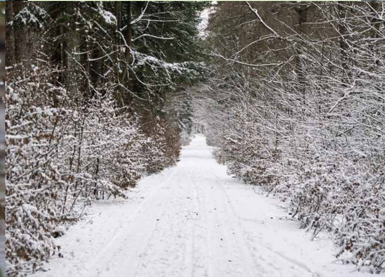
130 692 $ Tracteur pour balayage et déneigement des sentiers