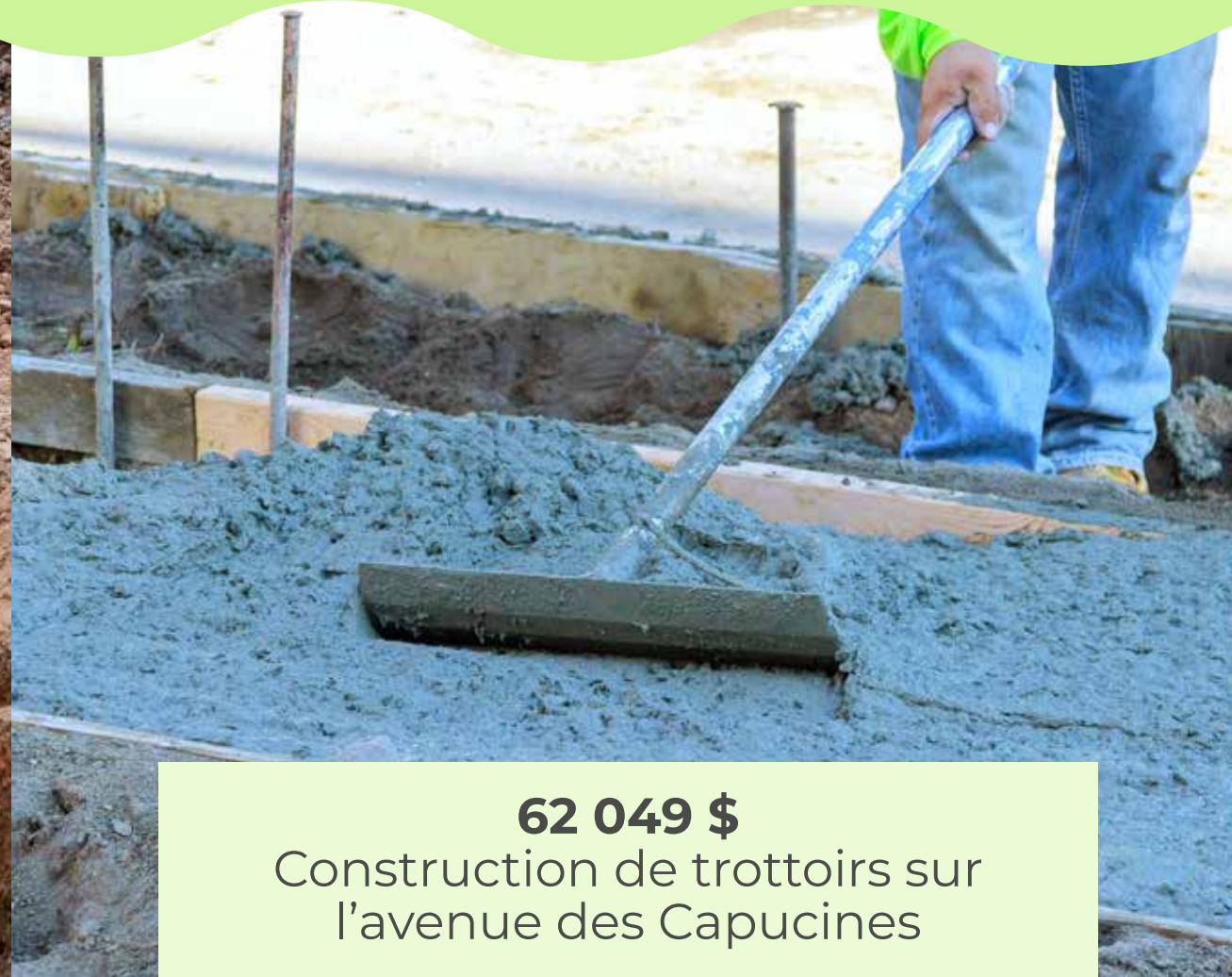
62 049 $ Construction de trottoirs sur l'avenue des Capucines