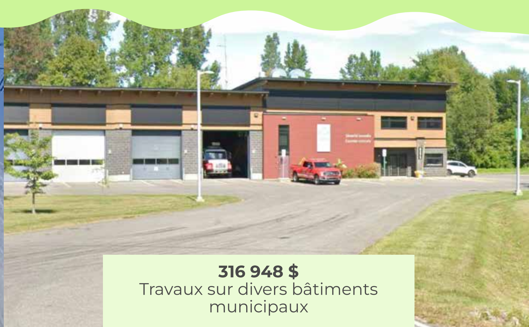
316 948 $ Travaux sur divers bâtiments municipaux