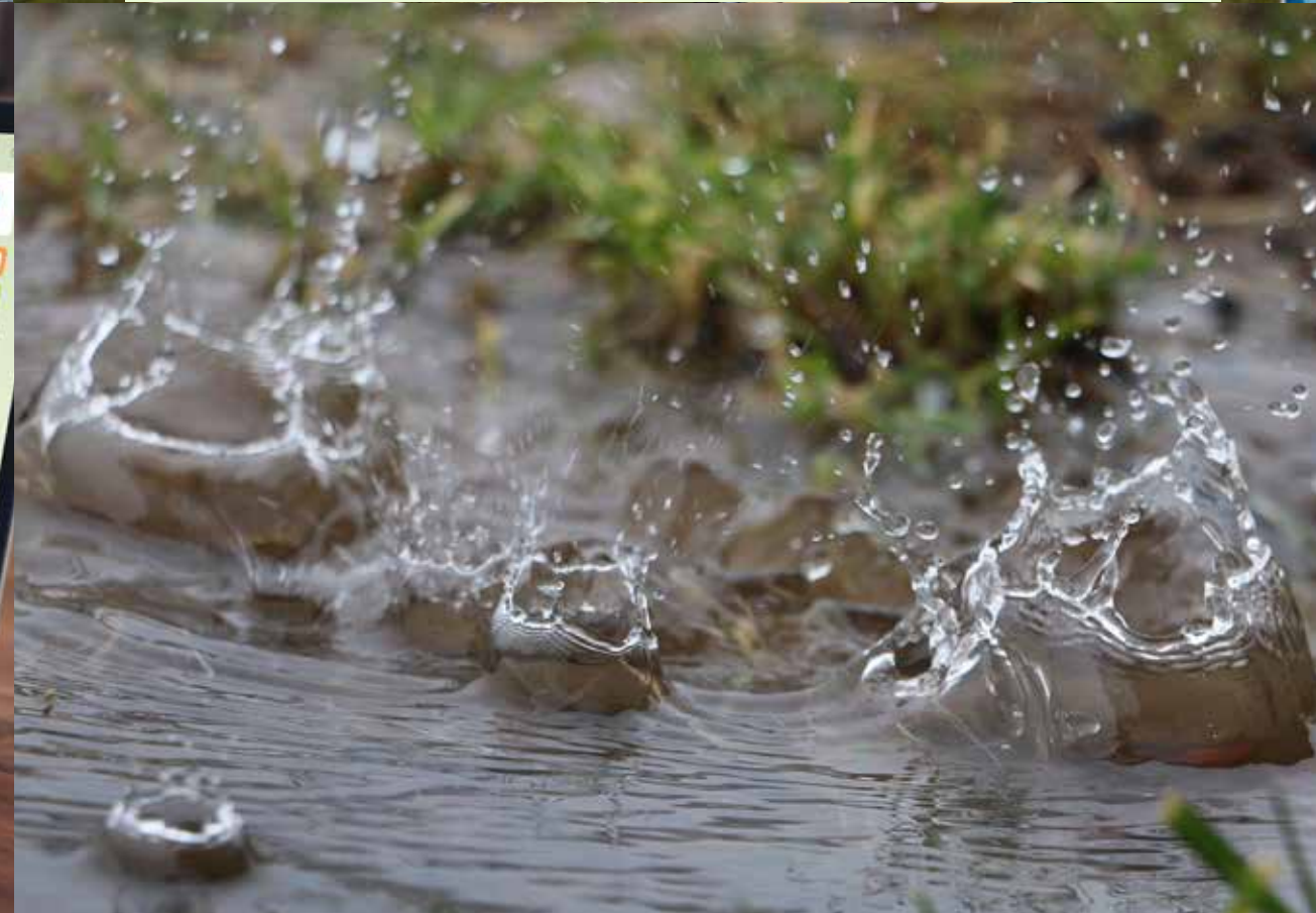
53 928 $ Programme d'aide aux changements climatiques