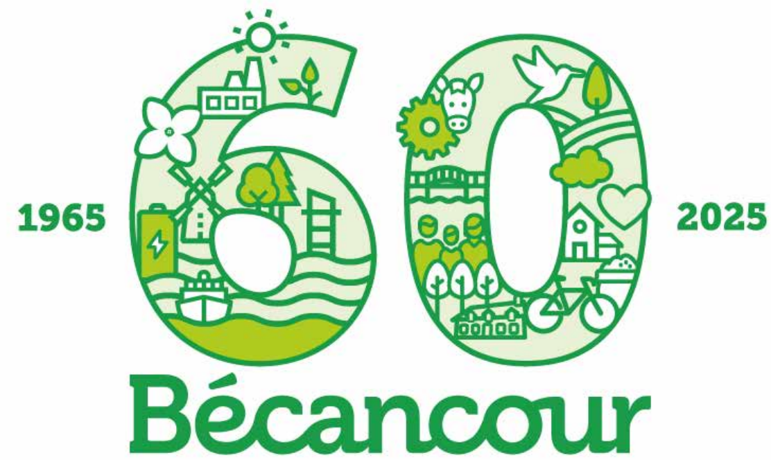
60 000 $ 60 e anniversaire de la Ville