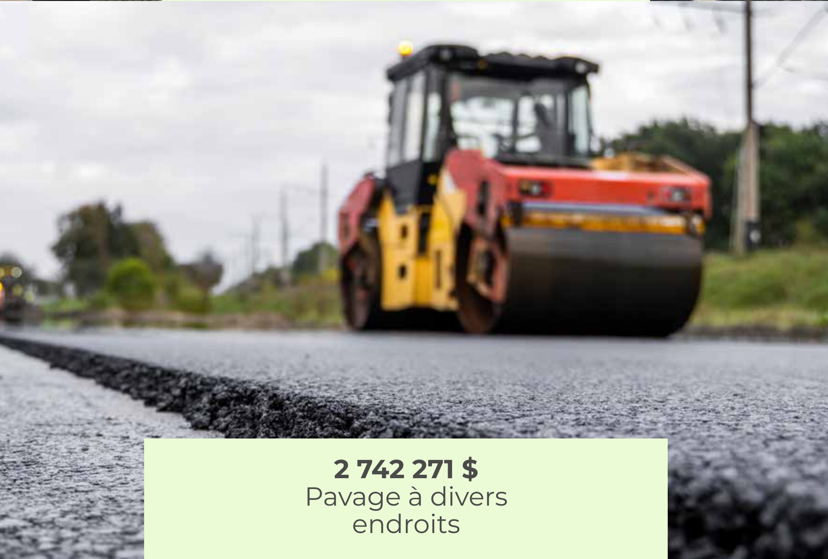
2 742 271 $ Pavage à divers endroits