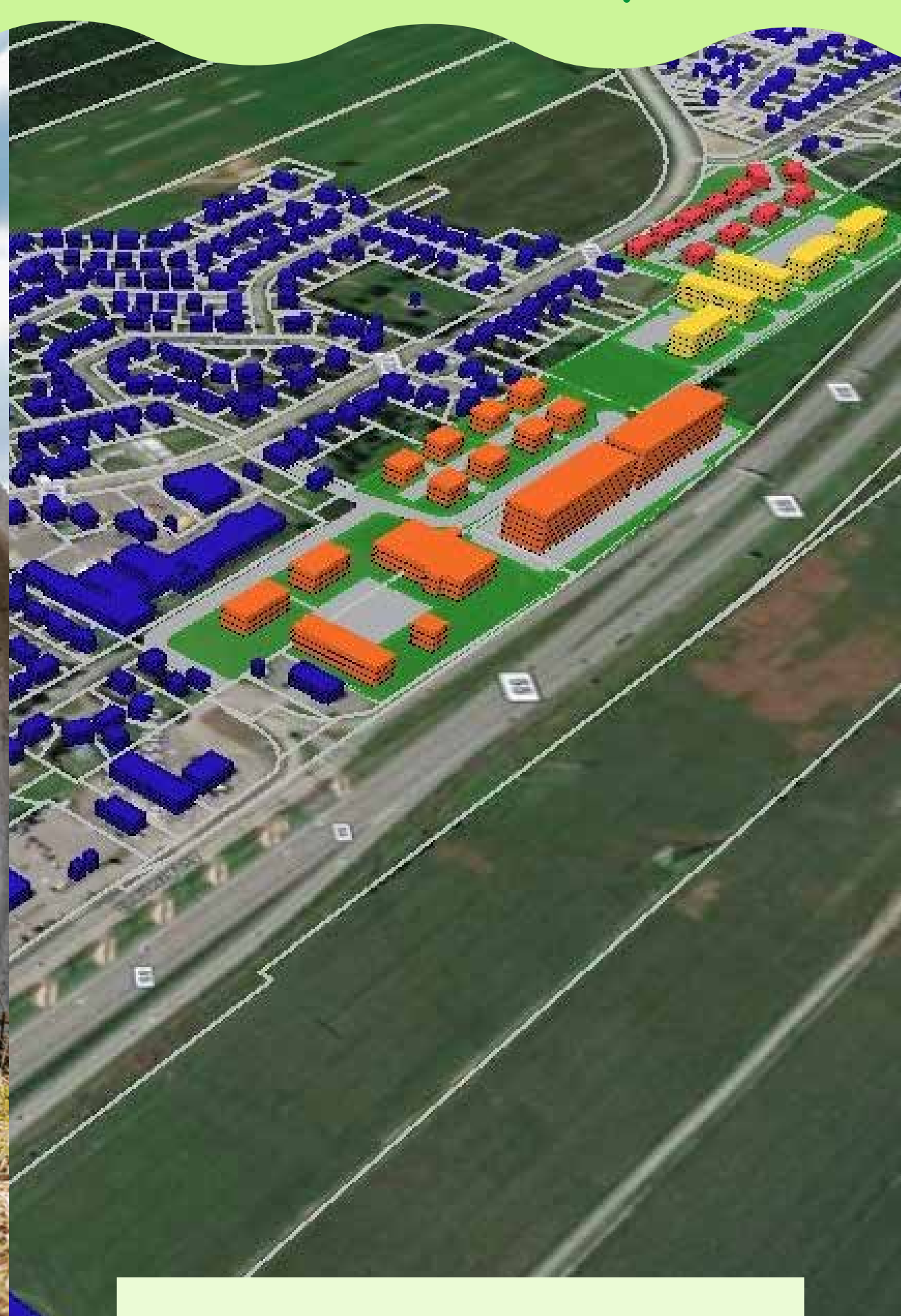
Poursuite d'innovations numériques et de l'utilisation de l'IA dans la performance de la Ville Ex. : Géomatique, Gestion de projets, IA