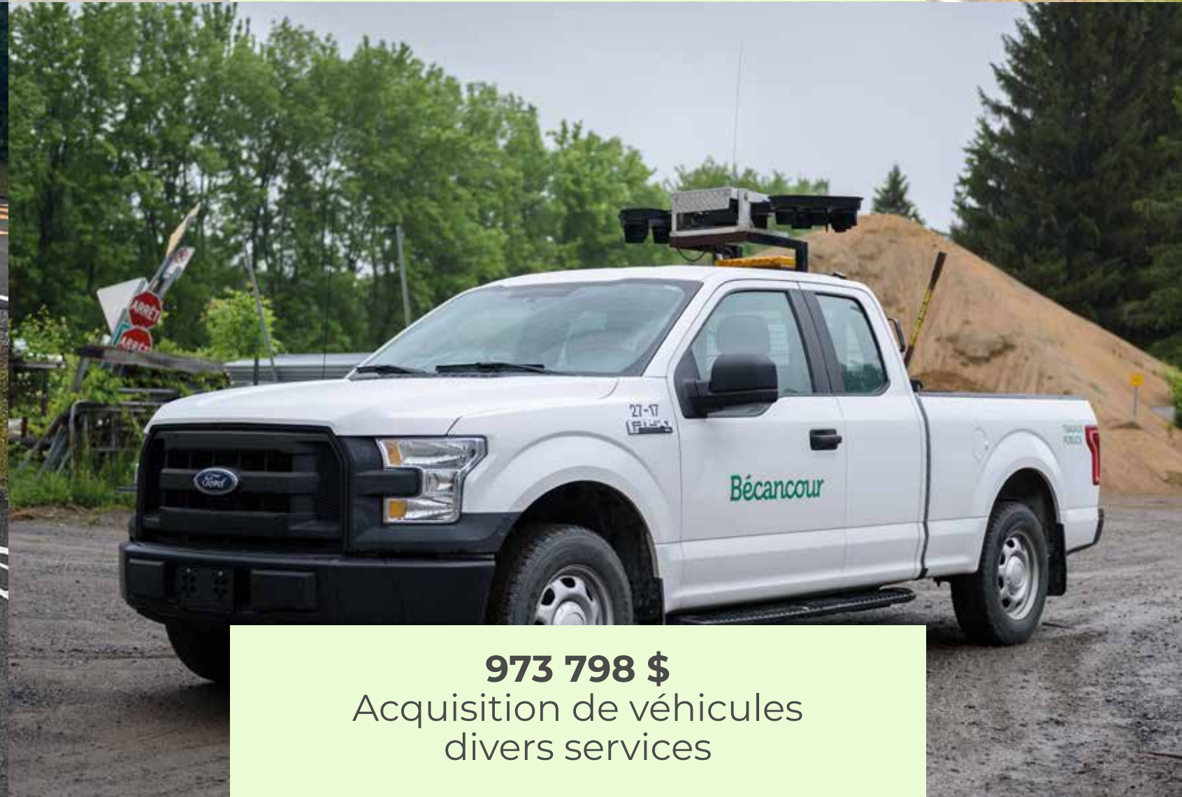
973 798 $ Acquisition de véhicules divers services