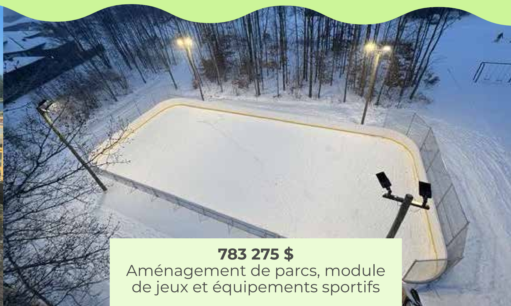
783 275 $ Aménagement de parcs, module de jeux et équipements sportifs