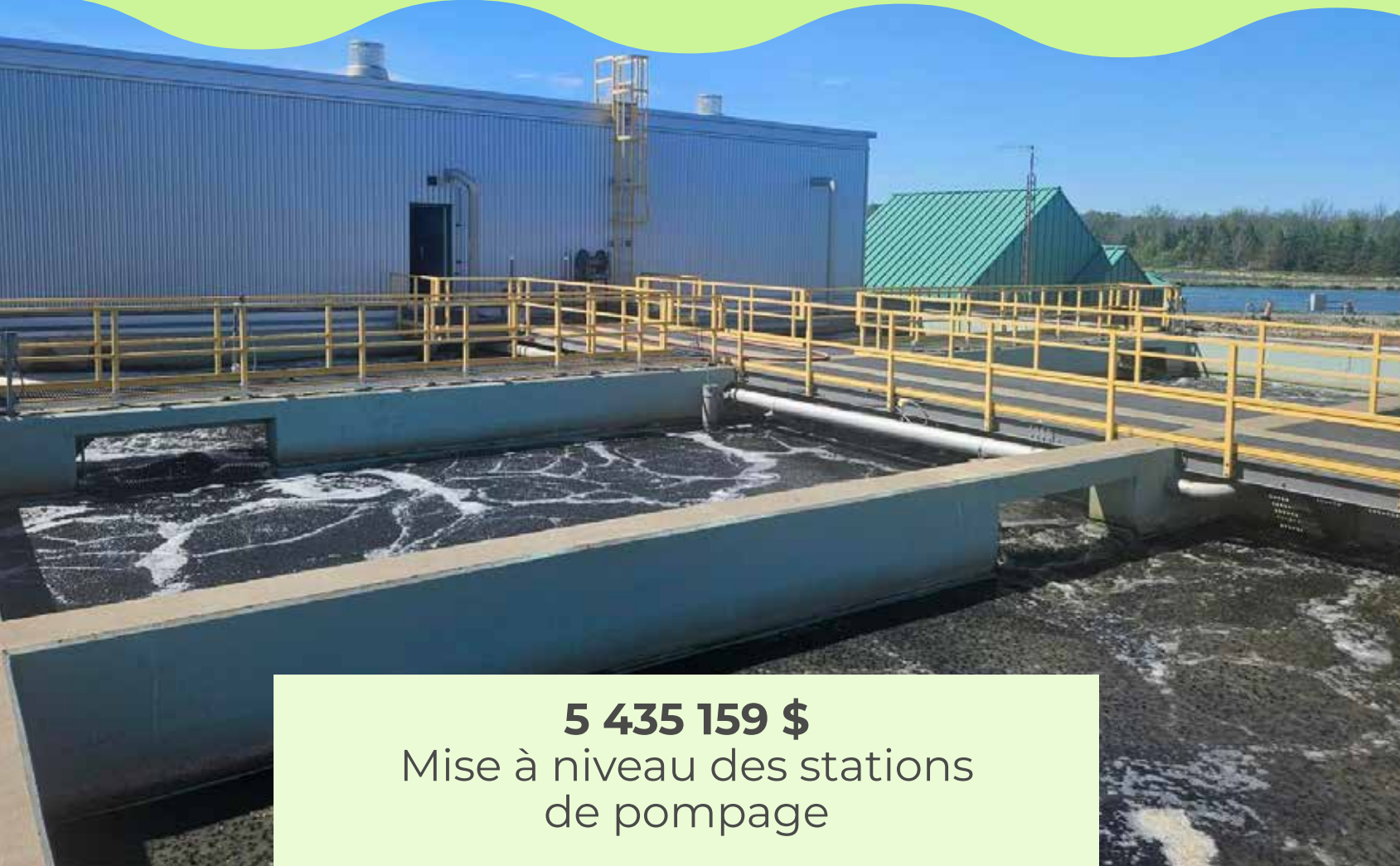
5 435 159 $ Mise à niveau des stations de pompage