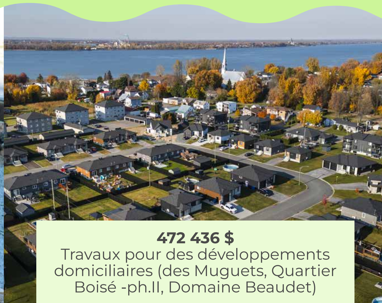
472 436 $ Travaux pour des développements domiciliaires (des Muguets, Quartier Boisé -ph.II, Domaine Beaudet)