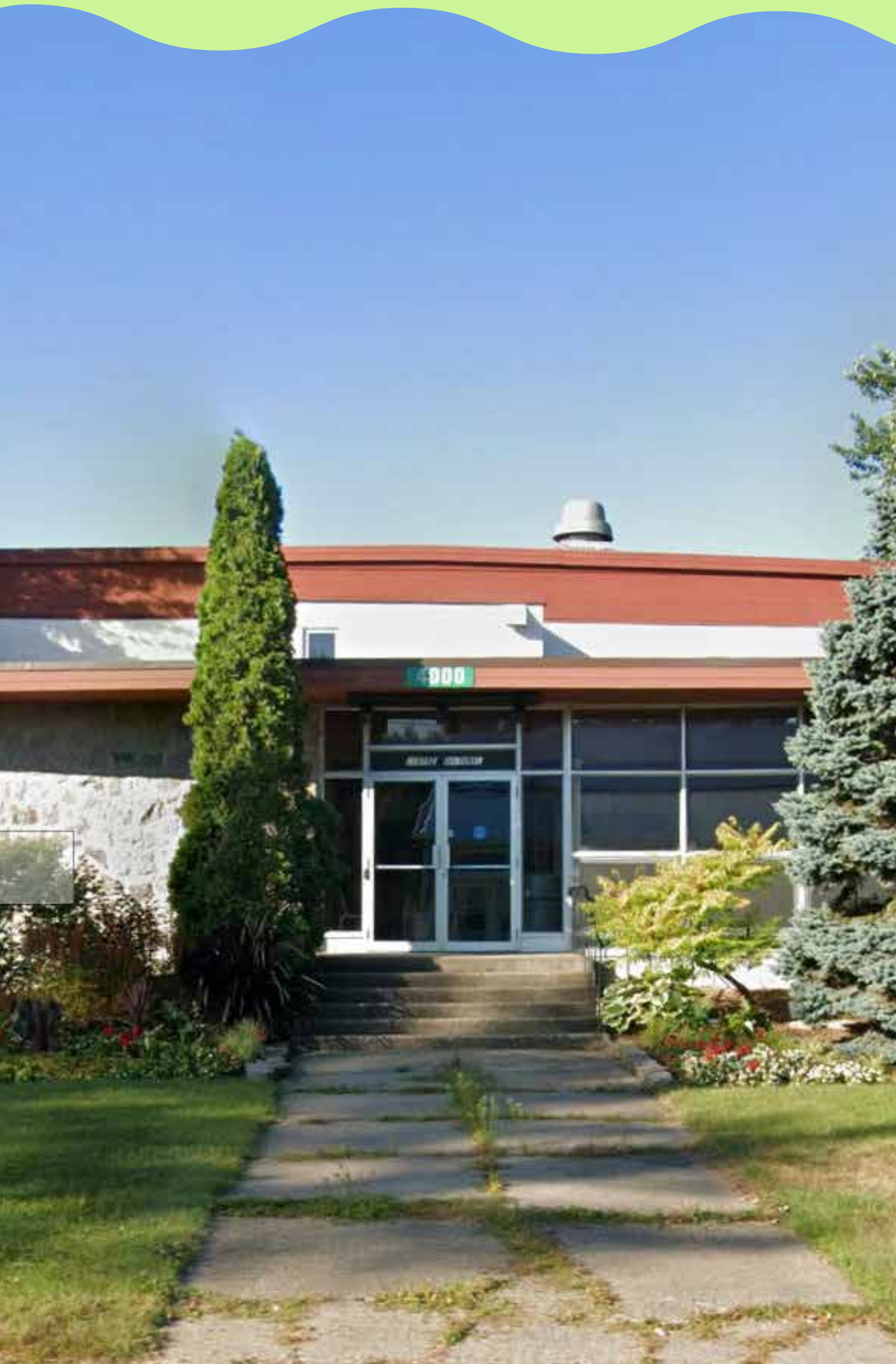
Réfection de bâtiments municipaux en lien avec l'audit des bâtiments Ex. : Centre culturel Larochelle

Un conseil municipal rêveur, mais responsable !