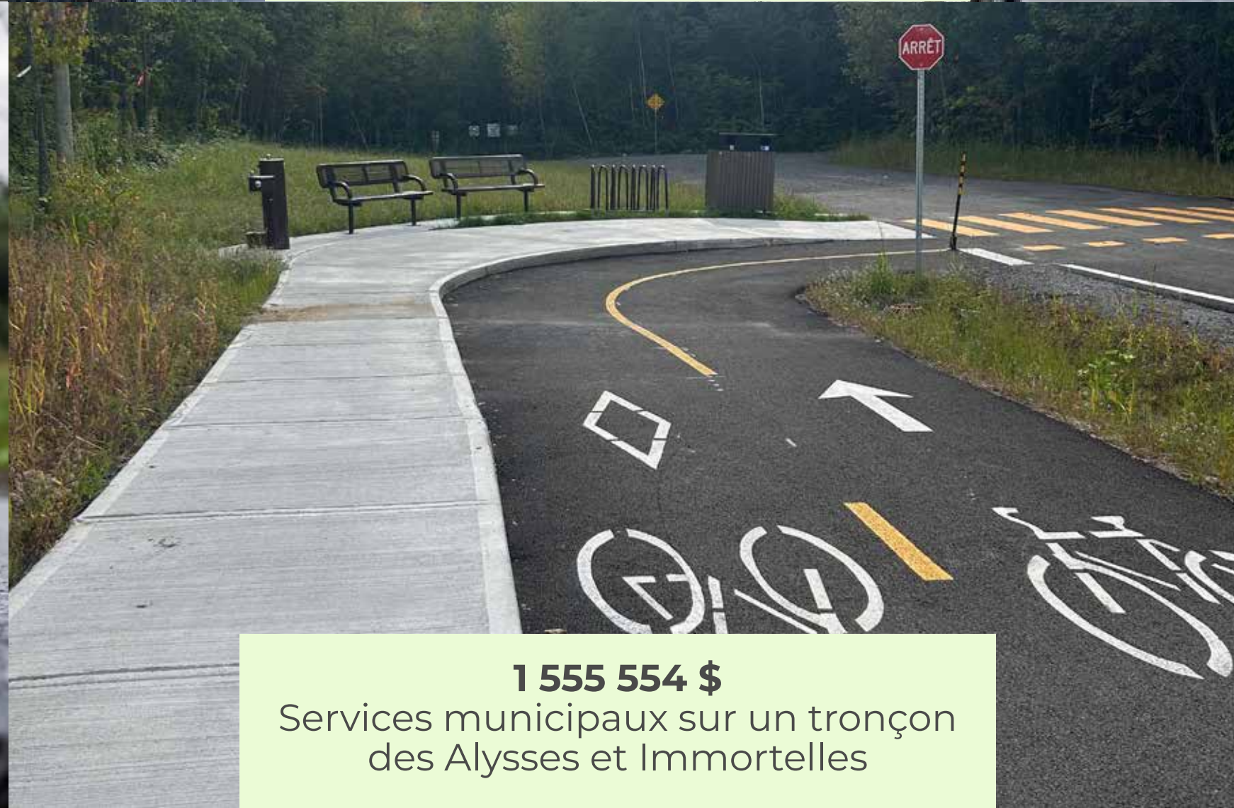
1 555 554 $ Services municipaux sur un tronçon des Alysses et Immortelles