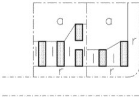
Schéma des cours

r : cour (voir définition) l : cour latérale (voir définition) a : cour arrière (voir définition)